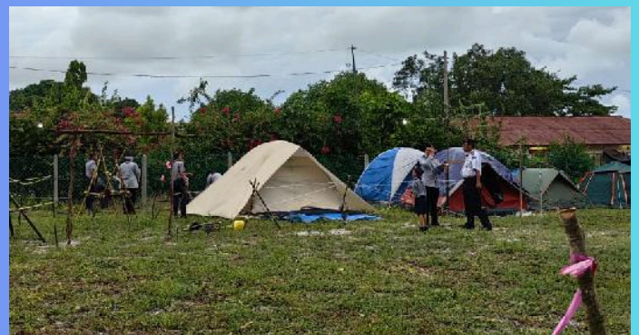
Persiapan Tapak Perkhemahan