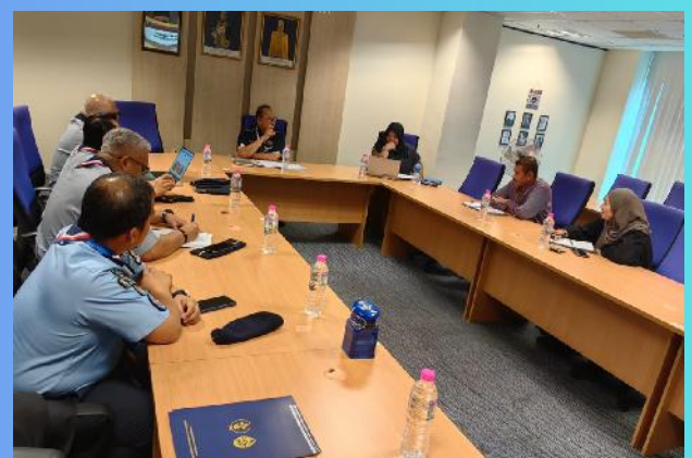
Perbincangan halatuju Kelanasiswa Malaysia khususnya di Politeknik